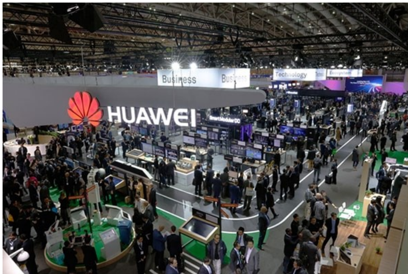
( http://static.taichinhdienu.vn/w630/Uploaded/huyenntt/2017_03_22/huawei_LNRT.jpg )

(eFinance Online) - Tại CeBIT 2017 đang diễn ra tại Hannover (Đức) từ ngày 20-24/3/2017, Huawei đã hợp tác cùng với 100 đối tác để giới thiệu về các giải pháp và chiến lược ICT với chủ đề “Đ dẫn đầu ICT mới, Con đường tới Chuyển đổi Kỹ thuật số”.